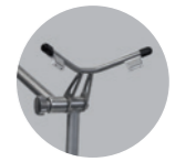
magnetischer Baghalter: 100 Euro