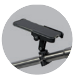
Handyhalter: 39 Euro