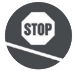
Elektronische Standbremse für Nitro-Modell: 200 Euro