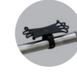
Handyhalter Silikon: 19,90 Euro