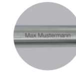
Namensgravur: 30 Euro