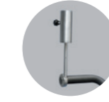
einstellbarer Schirmhalter Edelstahl: 120 Euro Titan: 150 Euro