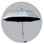
Golfschirm Automatik, UV-beschichtet mit Windcutter: 90 Euro