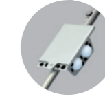
Scorekartenhalter mit Ballhalter Alu: 100 Euro Black: 100 Euro