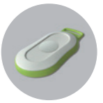
Fernbedienung mit Gestensteuerung (nur in Verbindung mit Classic-Steuerung): 390 Euro