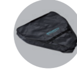
Tragetasche für Evolution und Zorro flat: 110 Euro