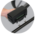
Flugatterie mit 99 Wh: 290 Euro