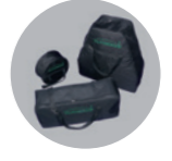
Tragetaschen: 110 Euro Rädertasche: 30 Euro