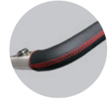
Ledergriff: 100 Euro