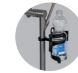
Flaschenhalter: 29 Euro