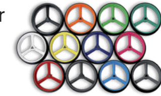
farbige Räder ohne Aufpreis